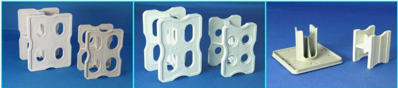
▲H70-80-90-100、H50-60-70-80 ▲H40-50-60-70、H30-40-50-60 ▲PL(プレート)付H30-40、H30-40